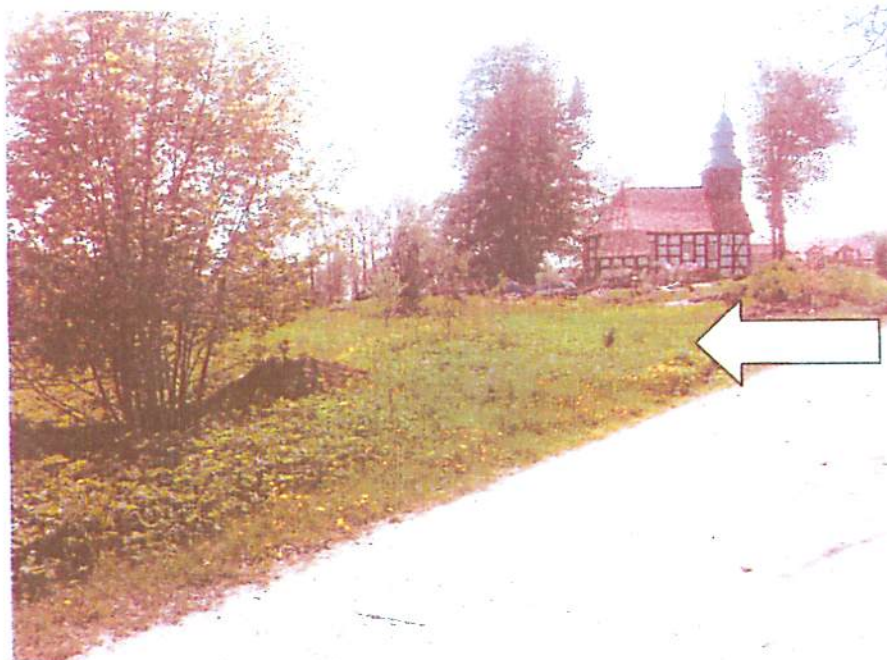
Widok od strony drogi gminnej